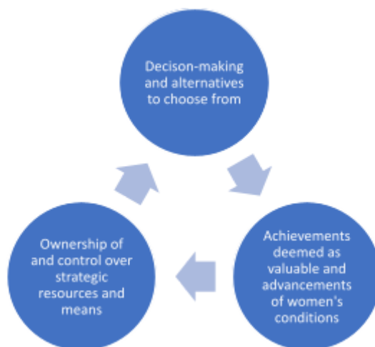
Diagrama 2: Interrelaciones. Adaptado de los recursos, la agencia y los logros de Kabeer.